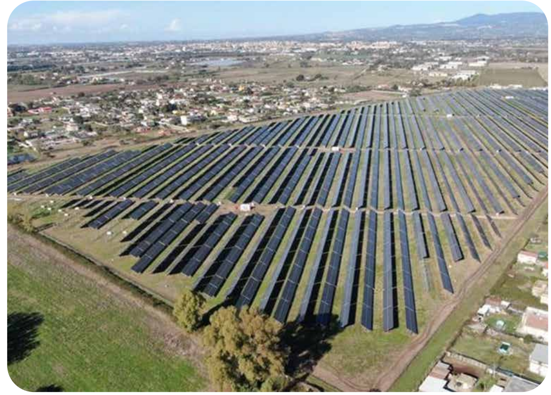
Sito Aprilia - Dopo la costruzione