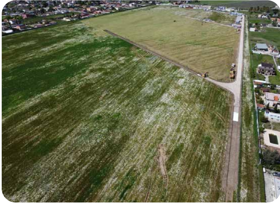
Sito Aprilia - Prima della costruzione